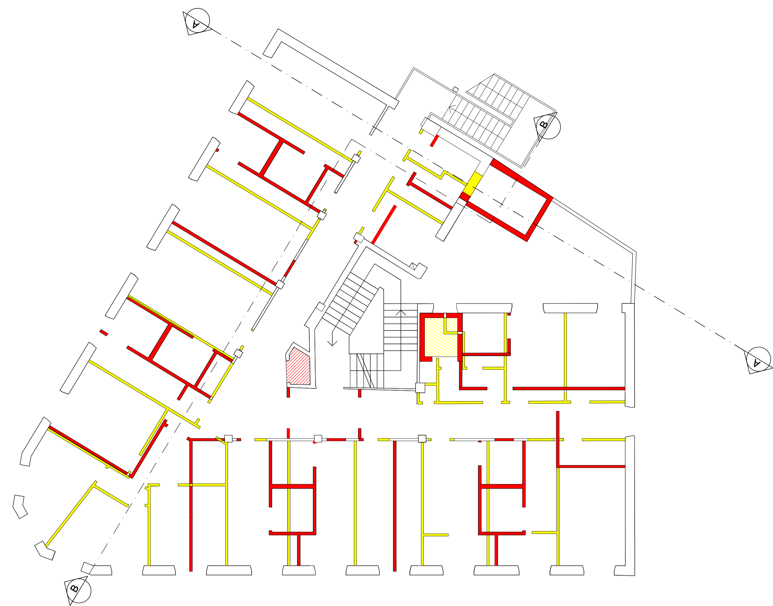
Pianta piano terzo